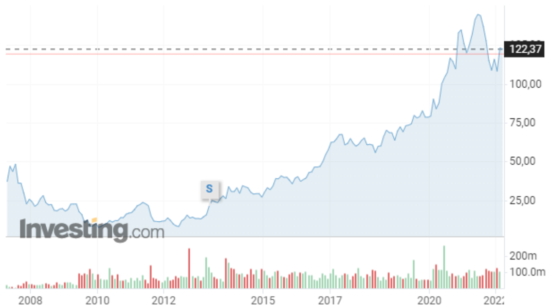
Gráfico de T-Mobile en Investing.com desde abril de 2007.