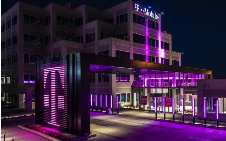
Oficina de Bellevue, Washington