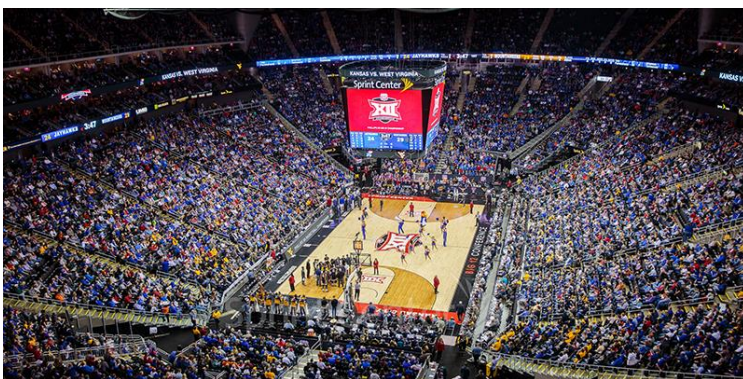
Interior del T-Mobile Center

Actualmente, T-Mobile cotiza en la bolsa de valores NASDAQ, con un valor de la acción de 122$ (09/03/2022) y con una capitalización de mercado de 151'93B de dólares.